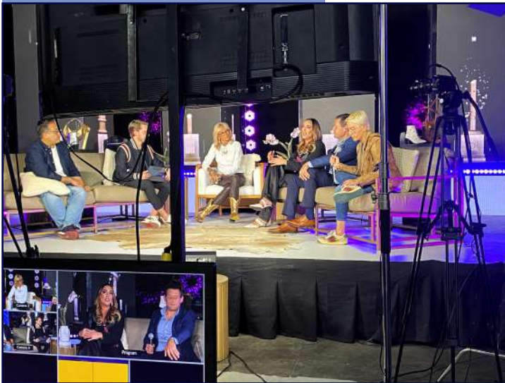
Adela en entrevista