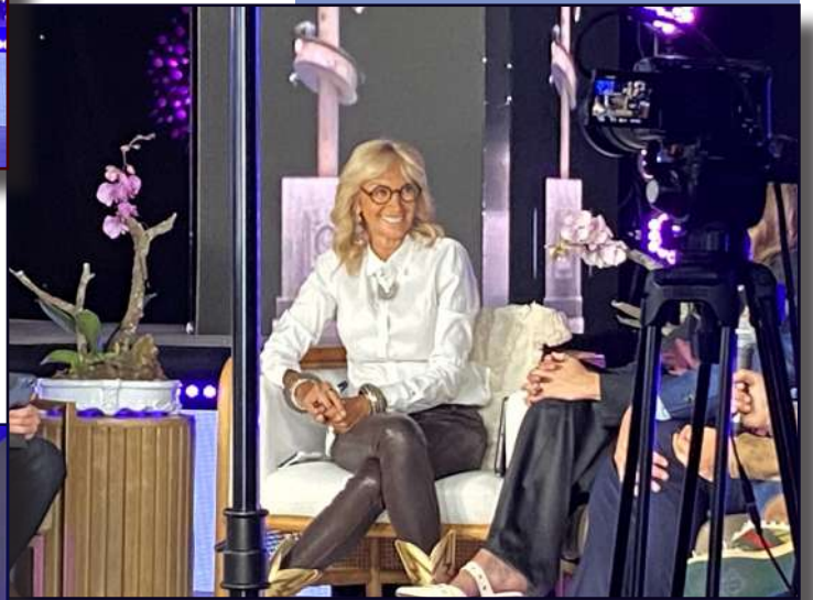
Adela Micha, en transmisión