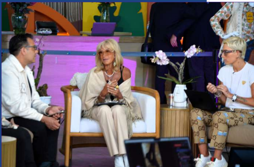
Adela Micha y su equipo en Sapica #90

L eón, Guanajuato - En el marco de la edición número 90 de Sapica, en el Poliforum de León hubo un elemento adicional que añadió un toque de distinción y amplificó la voz de esta industria: la presencia de Adela Micha y su popular programa "Me lo dijo Adela", transmitido en vivo y en directo desde el corazón del evento.