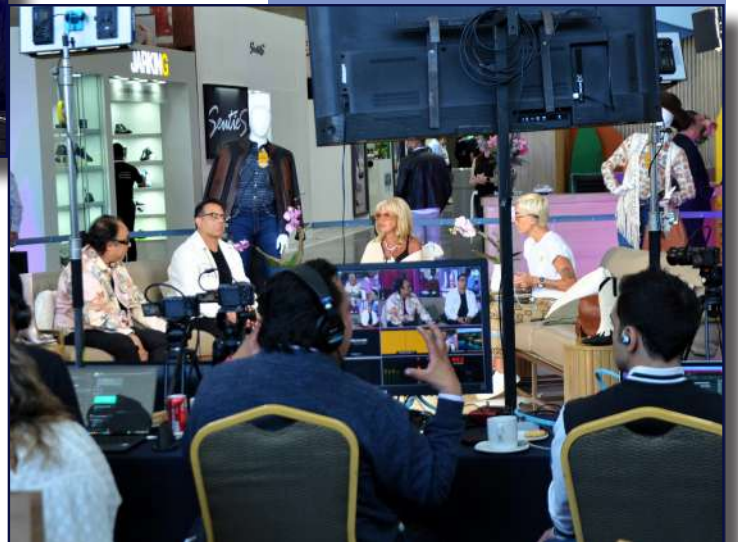
Equipo de producción en Sapica